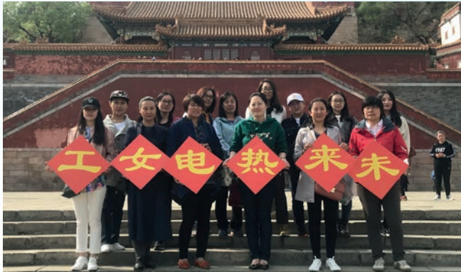
「三八婦女節」主題活動

每年，本集團為員工舉辦豐富多彩的文體活動，例如體育文化節、節日聯歡、電影觀看、趣味運動會、秋季旅遊、書畫作品展與園藝博覽會參觀等等，以促進員工工作與生活的平衡及加強員工之間的關係。